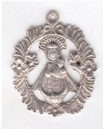
Medalla de Nuestra Señora de Nieva del siglo XVIII. (Col. del autor)

Cojos, mancos, tullidos, / ciegos y sordos, en la Santa Cruz hallan / consuelo todos; que es tan hermosa, / que la escogió Cristo para su Esposa.