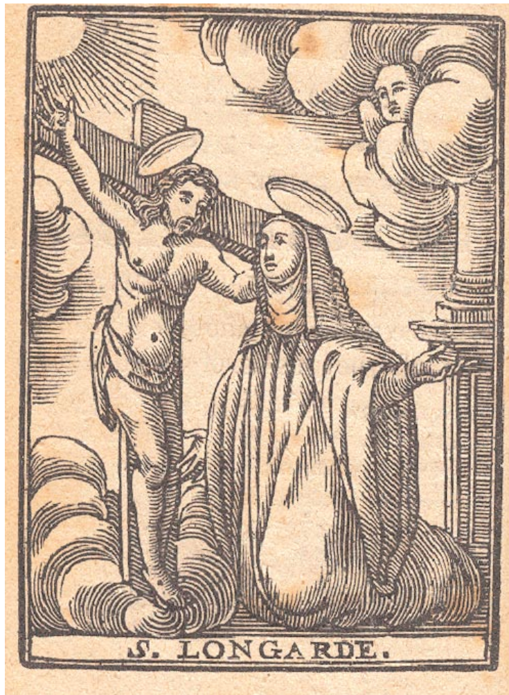
Estampas de San Ramón Nonato y Santa Lutgarda, especiales abogados de las mujeres preñadas, procedentes de un novenario catalán de 1872. (Col. del autor)

–Torrecilla del Pinar y Fuentepiñel de Fuentidueña–, de que las gestantes portaran durante nueve meses, colgado al cuello, el escapulario de la Virgen del Carmen y tener en casa una cruz de Caravaca, que aquí denominan cruz de “Alcaravaca” 8 , para tener una buena gestación.