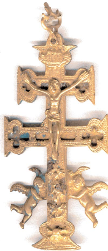
Cruz de Caravaca que sigue los modelos propios del siglo XVIII (Col. del autor).

Casi todas las cruces de Caravaca se emparentan con aquellas de doble brazo con los extremos acampanados y asa basculante, girada. En una cara se suele representar a Cristo crucificado al frente bajo la cartela de INRI